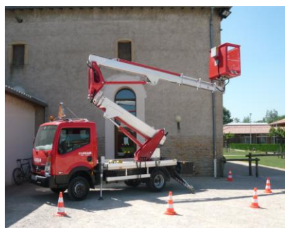
PEMP type 1B PEMP utilisée à poste fixe à élévation multidirectionnelle