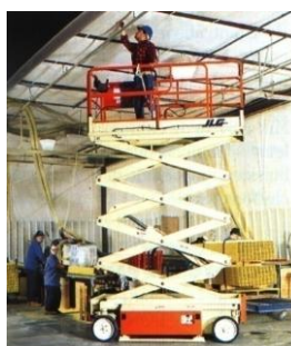
PEMP type 3A: PEMP automotrice à élévation Verticale (ciseaux par exemple)

Note: PEMP très peu rencontrée (Utilisé notamment par EDF pour les inspections de ligne)