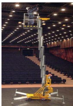
PEMP type 1A PEMP à poste fixe et à élévation verticale)