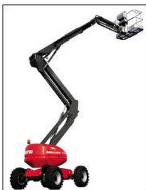
PEMP type 3B PEMP automotrice à élévation multidirectionnelle